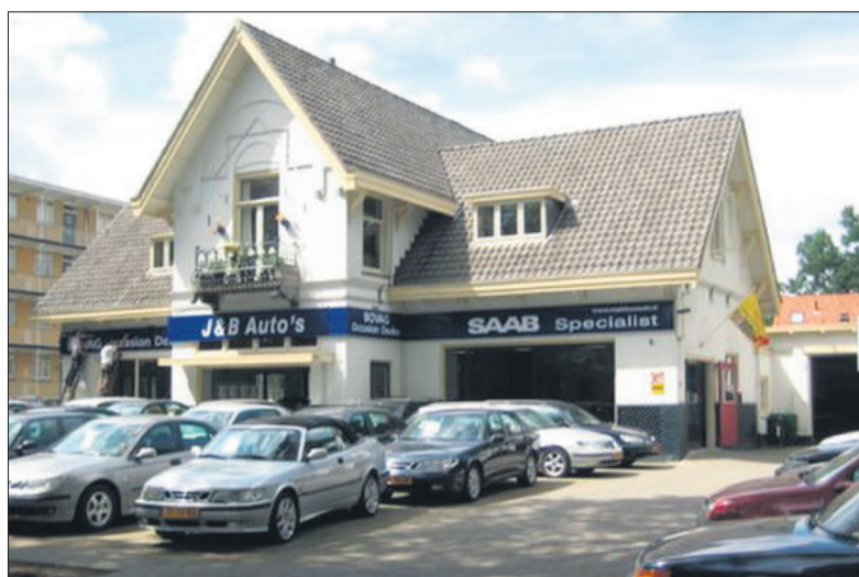
■ J&B Auto's in 2008.

FOTO EN TEKST: STREEKARCHIEF GOOISE MEREN