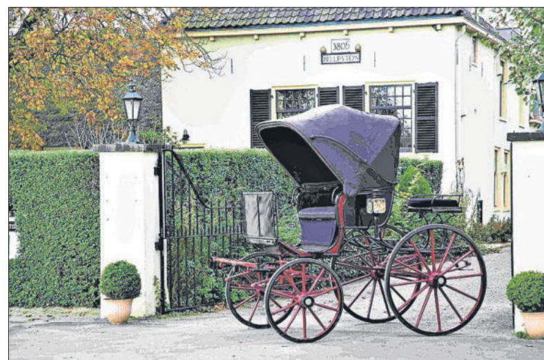
■ Napoleon Phaeton, gemerkt Tattersall, in de collectie De Nerée tot Baberich, Wassenaar.

Blijkens latere advertenties bleef het 'Van Zalinge's Automobielenbedrijf' heten. In 1939 werd Pellens officieel Opel-dealer, maar vanaf 1940 zakte de autoverkoop weg. Pellens loste dit op door gasgeneratoren voor turf en hout te gaan