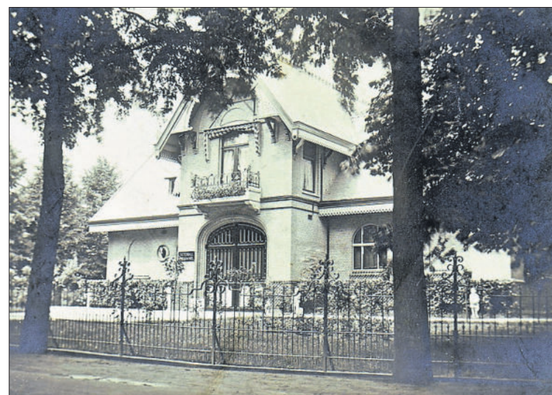
■ Het koetshuis in 1910.