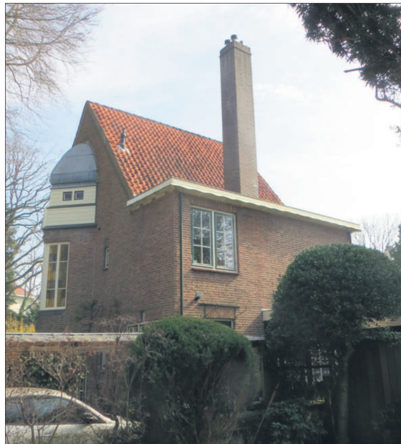
Koedijk 17 Bussum (1920), ontworpen door P.J. Hamers.

gezin een voormalige onderwijzerswoning aan de Kortenhoefse dijk in Kortenhoef. Tien jaar later verhuisde hij naar het door zijn vader ontworpen huis ('Kieviten') verderop aan de dijk. Hij