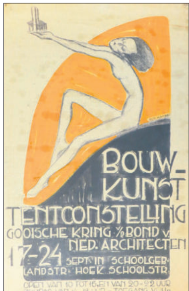
Poster (50 bij 80cm) van kunstenaar Hamers voor tentoonstelling in Bussum, waar onder andere architect Hamers aan deel nam.

Na 1945 bouwde hij niet veel meer. Wel presenteerde hij in 1946 een plan om Naarden-Bussum te ver-