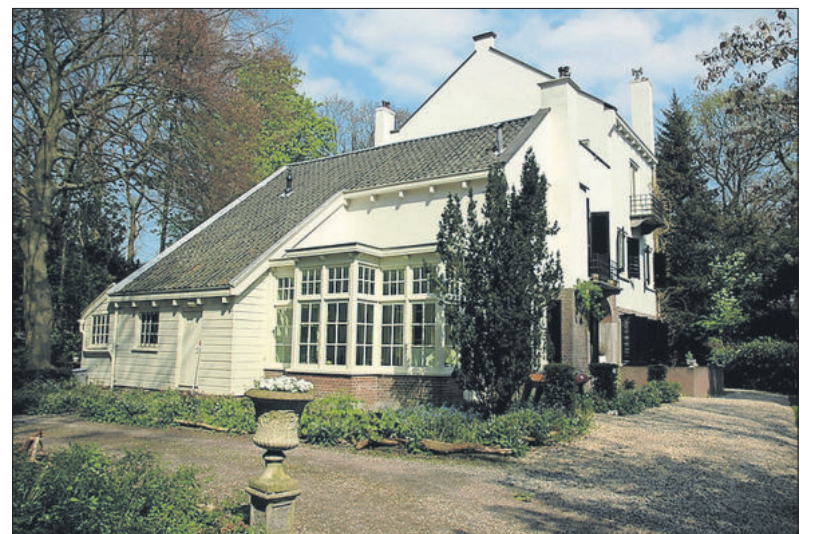
■ De villa van Breitner in Aerdenhout.

Bauer tekende de hutten die in de kolonie van Frederik van Eeden kwamen. Voor familie en vrienden van Van Eeden die niet in een