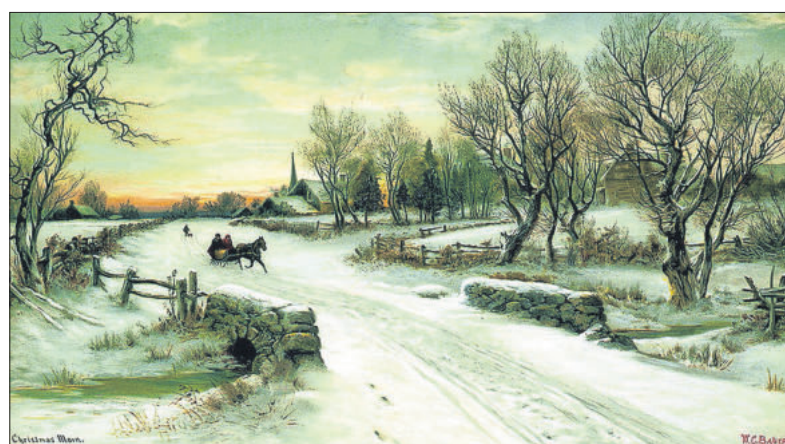
■ Christmas Morn (1885).

FOTO EN TEKST: STREEKARCHIEF GOOISE MEREN