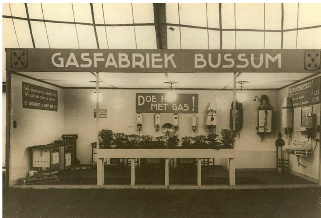
Toonkamer van de gasfabriek