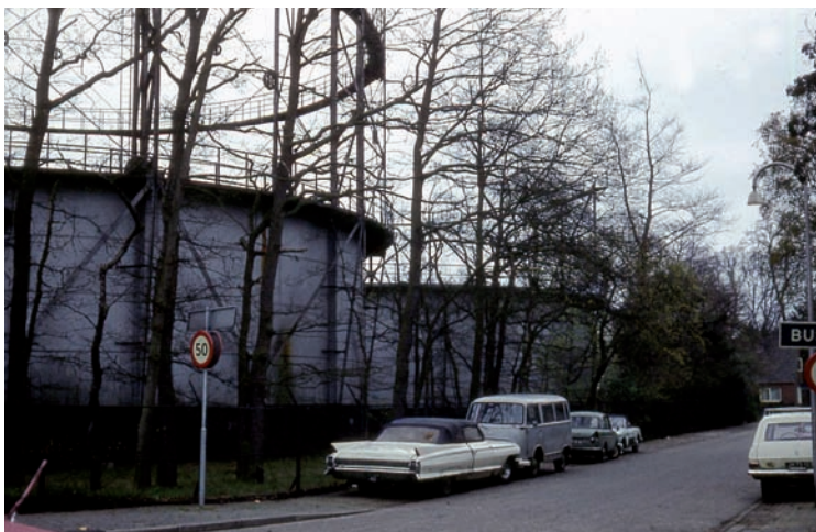
De gashouders in de jaren zestig, gezien vanaf de kruising Zwarteweg-Lomanlaan

krant gaf informatie over de gratis (door het gasbedrijf betaalde) ombouw, maar bevatte ook de inruilprijzen die het gasbedrijf bood voor oude apparatuur die op dat moment door nieuwe werd vervangen en advertenties waarin de nieuwe apparatuur werd aangeprezen. Voor inwoners voor wie de kosten een probleem waren, kwam er een betalingsregeling.