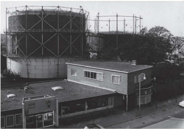
Kantoor en gashouders omstreeks 1956

moesten overstappen van kolen en olie op het veel goedkopere aardgas, en fornuizen en kachels moesten ervoor geschikt gemaakt worden.