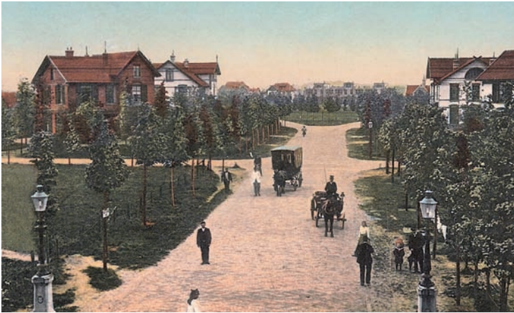
Gaslantaarns aan de Prins Hendriklaan, begin 20ste eeuw

net die daar het gevolg van was moeilijk aan en kampte daardoor geregeld met leveringsproblemen. Het aantal klachten bij het gemeentebestuur nam gestaag toe. Uit een door de gemeente ingesteld onderzoek bleek dat er op korte termijn talrijke verbeteringen moesten worden aangebracht. Deze gingen de financiële draagkracht van Hafkenscheid te boven en hij stelde daarom voor dat de gemeente de gasfabriek zou overnemen.