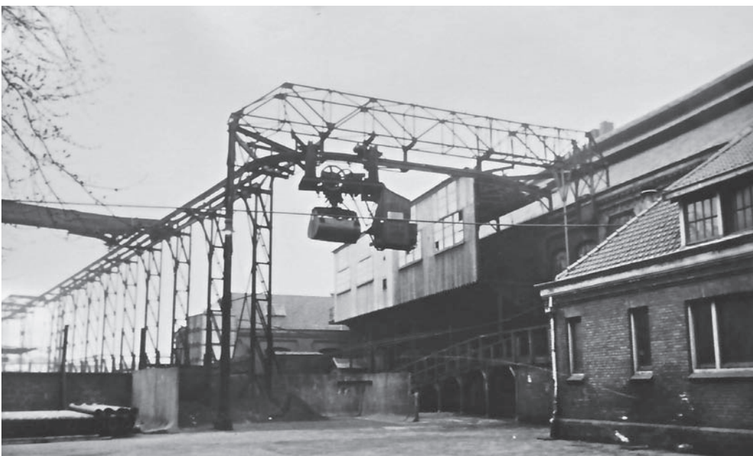
De transportinstallatie voor de kolen

Bussum groeide van nog geen 3000 inwoners in 1886 tot ruim 5000 in 1896. Het bedrijf kon de uitbreiding van het