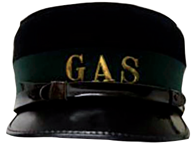
Pet van het Bussumse gasbedrijf

Bussum geheel beëindigd. Het Bussumse gasbedrijf verzorgde vanaf die datum alleen nog de distributie van het in Hilversum geproduceerde gas. De kolentransportbaan werd afgebroken.