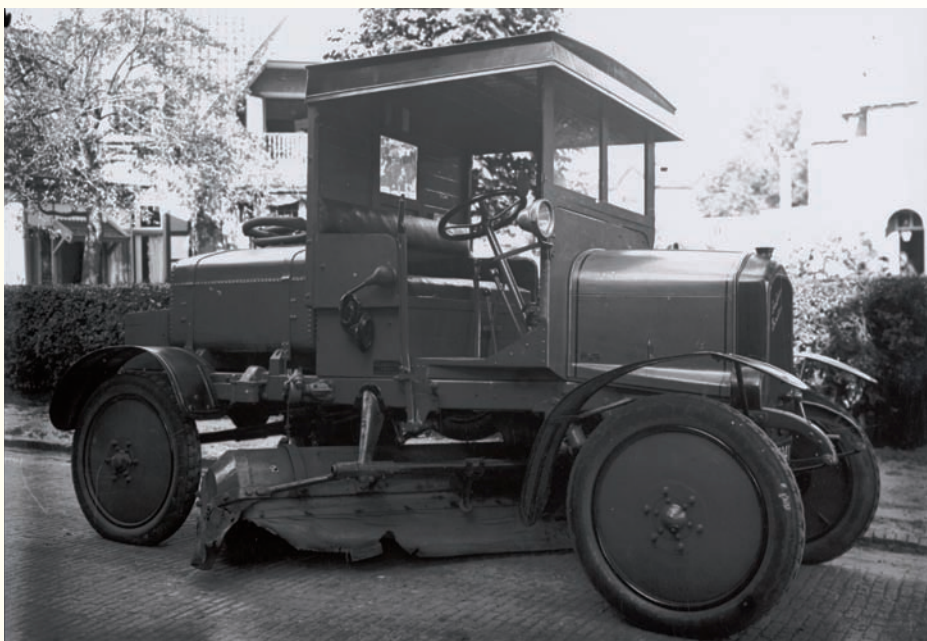
Moderne veegmachine in 1930 (Gemeentearchief Gooise Meren en Huizen)

In de raadsvergadering van 19 februari 1918 stelde het college van B & W voor om alle reinigingswerkzaamheden in eigen beheer te gaan uitvoeren, omdat de aanbesteding vaak belangrijk hoger uitviel dan de ramingen. Veel raadsleden vreesden