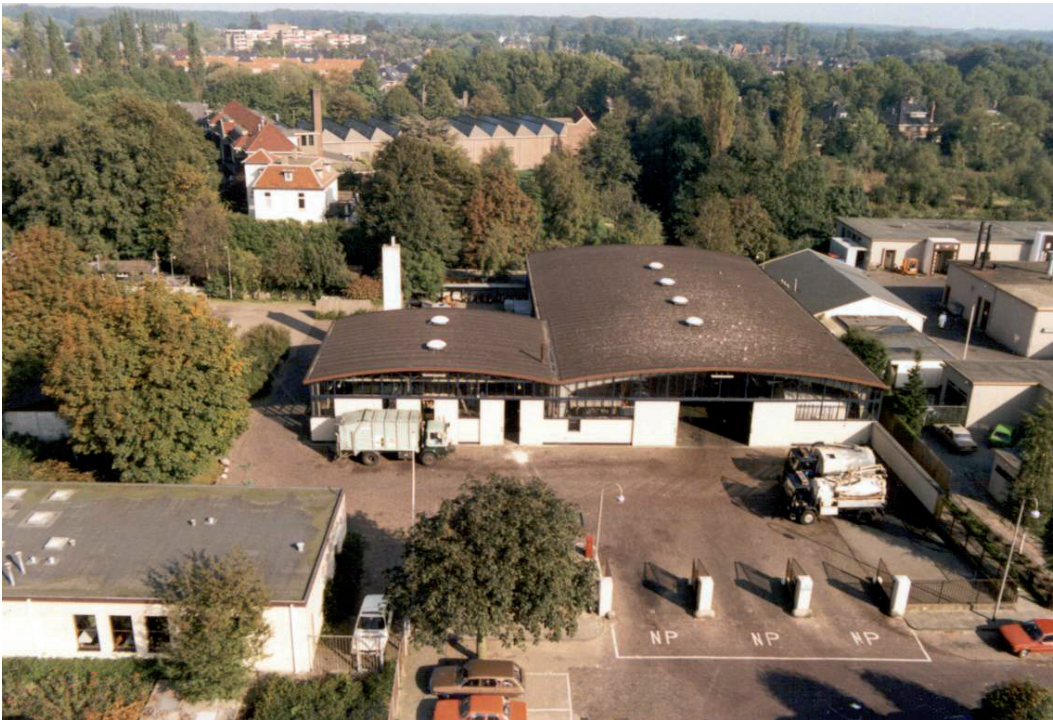
Het station van de Gemeentereiniging aan de Hoofllaan in 1985

aan de Loodijk in gebruik genomen. Door de afgelegen ligging van het terrein aan de Loodijk was er nauwelijks sprake van overlast. Doordat de stortplaats nu een flink stuk van de bebouwde kom lag, werd besloten om van paardentractie over te gaan op autotractie.