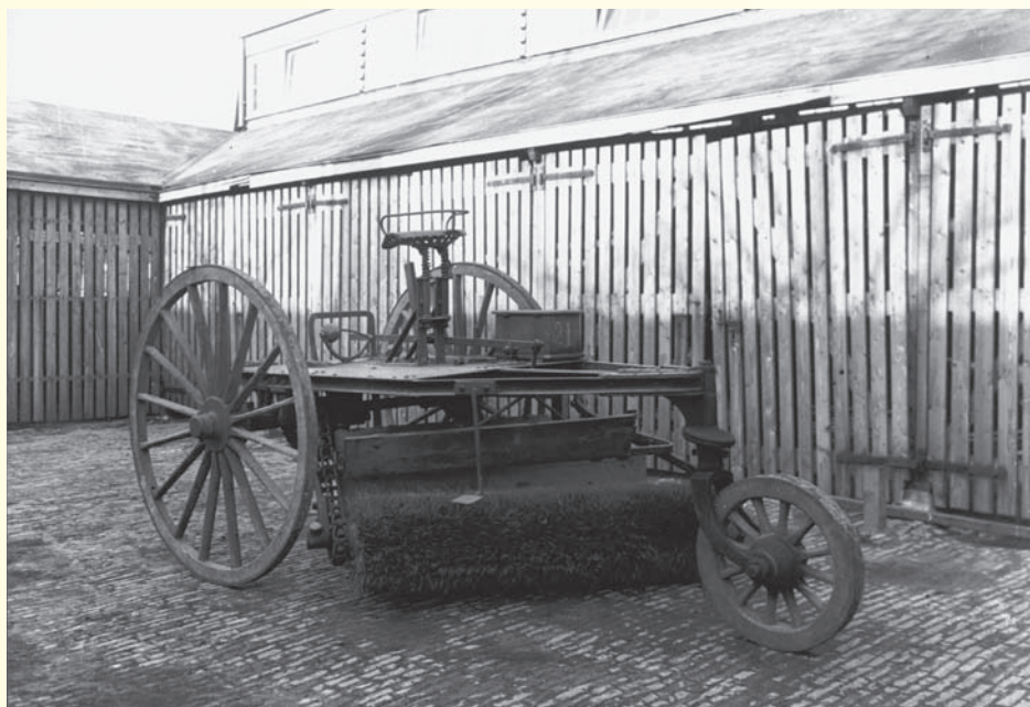
Een van de eerste veegwagens, omstreeks 1918

Verder was het reinigingsbedrijf ook verantwoordelijk voor het schoonhouden van straten en wegen, het schoonmaken en desinfecteren van urinoirs, het strooien van zand van de wegen bij gladheid en het opruimen van sneeuw en ijs. Bovendien moest het bedrijf de gymnastieklokalen van de openbare scholen schoon houden. De straten werden geveegd door werkmannen,