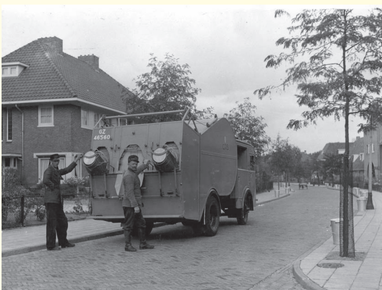
Vuilnis ophalen in de Simon Stevinweg in 1939