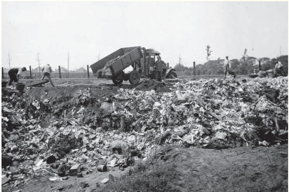
Vuilstort in de Eng. Goed is te zien hoe diep de stortkuil is