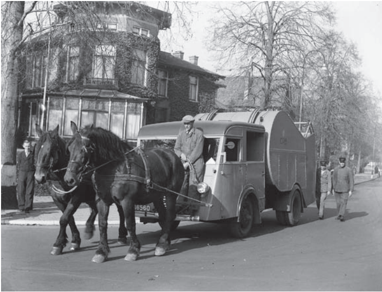
In 1941 moesten als gevolg van de benzineschaarste paarden de vuilniswagens trekken

overlast voor de omwonenden. Vooral 's zomers kon het flink stinken en door de situering van het terrein kon het vuil niet bij noordenwind worden verbrand, als de windrichting naar de hei was. Dit in verband met brandgevaar door vliegvluur. Het gevolg was dat de bewoners van de