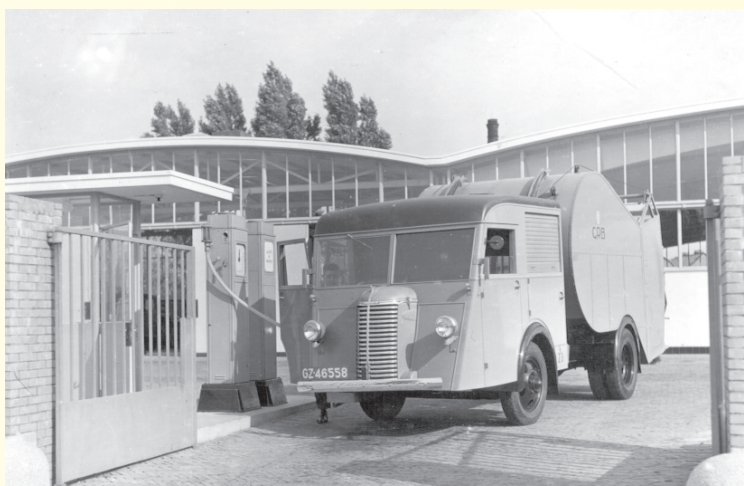
Vuilniswagen bij het station van de Gemeentereiniging aan de Hooftlaan, 1939 (Gemeentearchief Gooise Meren en Huizen)