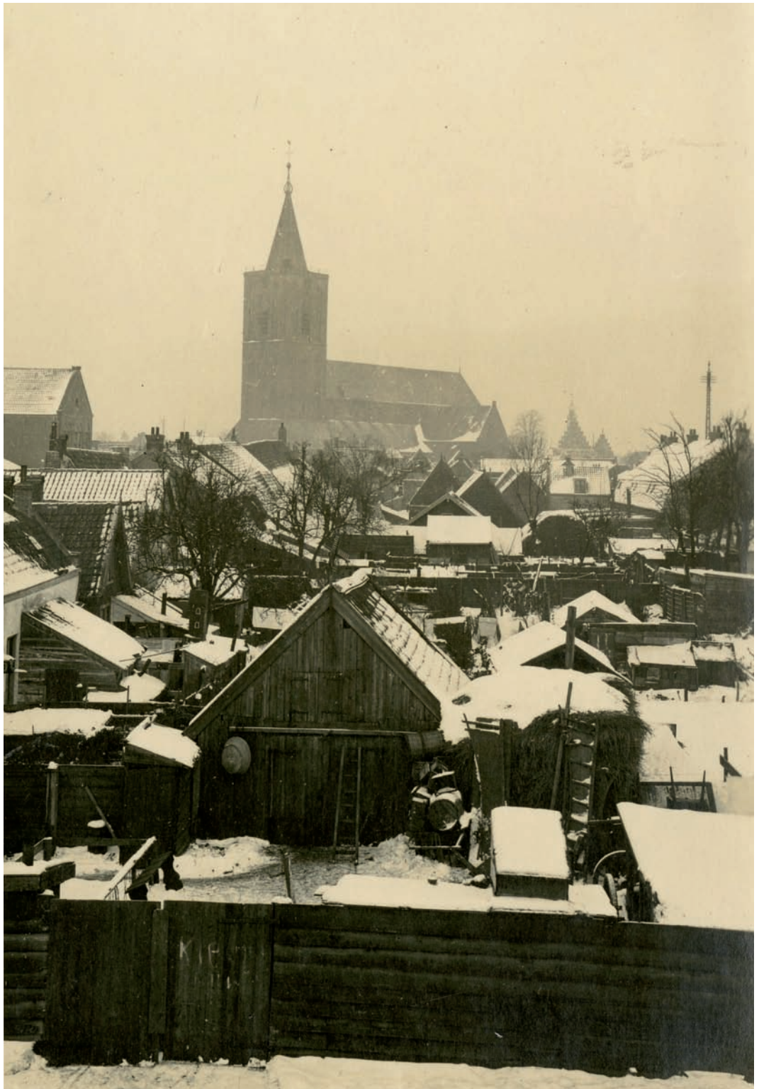
De fotograaf is via de Kippenbrug op de wallen geklommen en fotografeert vanaf de wallen de achtertuinen van de besneeuwde vesting. Aan de positie van de Grote Kerk en het dak van het stadhuis, dat nog net boven de daken uitsteekt, is te zien dat hij zich enigszins links van het bastion Turfpoort bevindt.