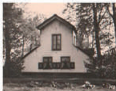
De Kamphoeve omstreeks 1930.

recreatie en natuurschoon. Het plan van de gemeente ging dus niet door. Enige jaren later, in 1950, kocht de gemeente alsnog de grond om het met het Goois Natuurreservaat (GNR) als natuurgebied te ruilen voor grond voor uitbreidingsplannen in het zuidoosten van Bussum. De prijs was lager dan in 1948, namelijk 60.000 gulden (€ 27.000).