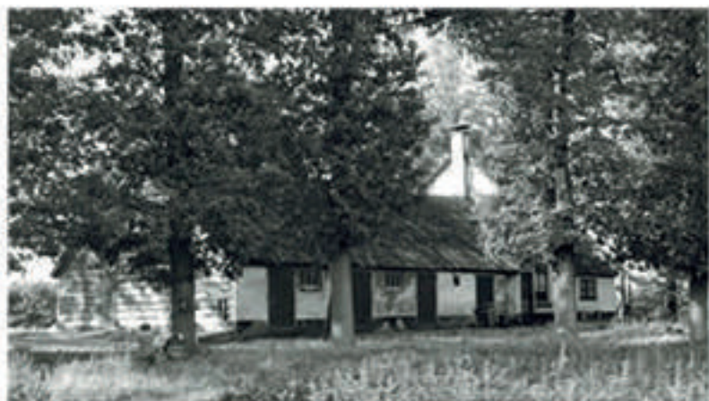
De Kamphoeve van de achterzijde gezien.