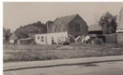
Laarderweg 114