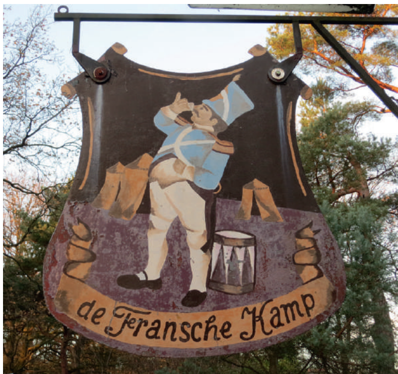
Het uithangbord bij de receptie van het kampeerterrein.