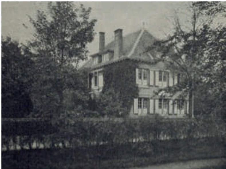
=De villa in 1925.