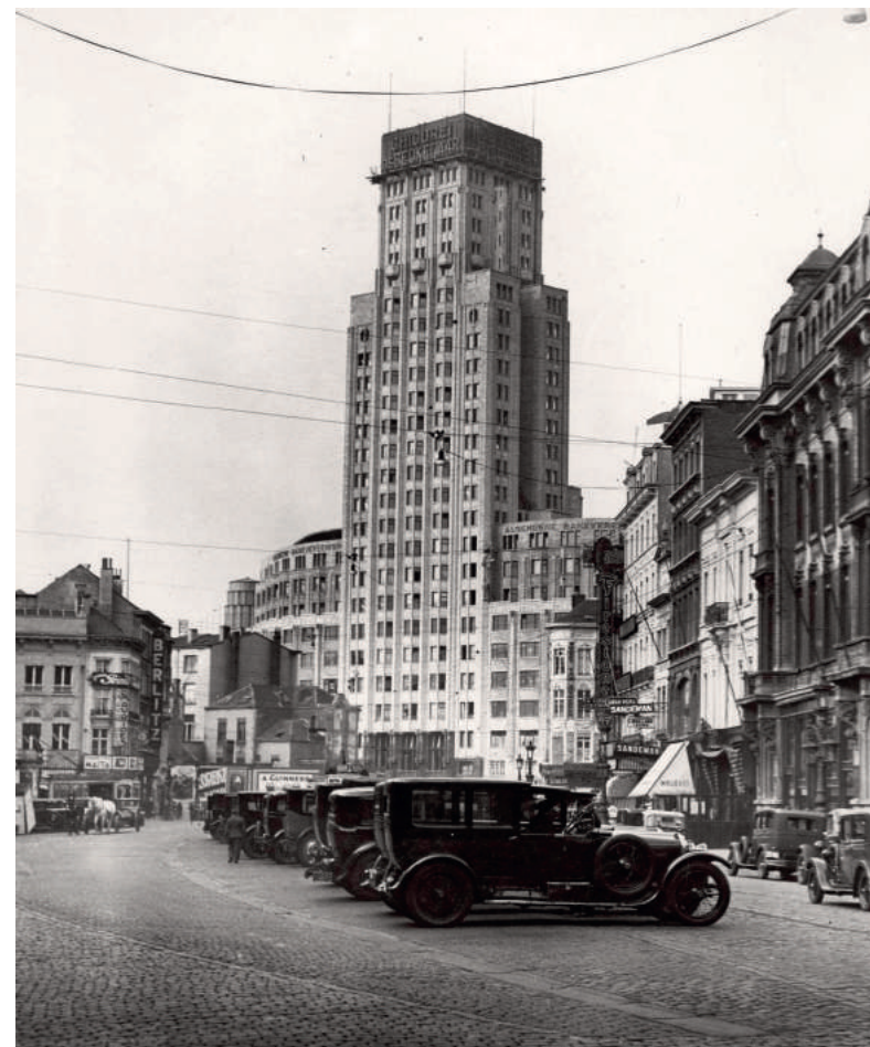
De "Boerentoren" of KBG-toren (1929) te Antwerpen.

Stationsweg 3 1404 AN Bussum www.historischekringbussum.nl tel. 035-69 129 68