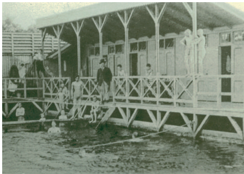
Het eerste zwembad aan de Huizerweg vlak na de aanleg in 1903.

Een stuk van 25 bij 10 meter was één meter diep en een stuk van 19 bij 10 meter was drie meter diep. Later heeft men een deel van de zwaikom voor ondiep bad geschikt gemaakt. De badmeester kon zelf niet zwemmen! Er waren 15 kleedhokjes. Jong en oud waren welkom en voor dames en heren waren er afzonderlijk vastgestelde uren. Forenzen konden 's morgens om zes uur al terecht. Het bad werd jaarlijks uitgebaggerd. Na de sloop in 1924 werd er op dezelfde plaats in 1926 een nieuwe badinrichting gebouwd. Er werden toen ook zwemlessen gegeven en de leeftijdsgrens werd 18 jaar. Ouderen konden toen naar het nieuwe zwembad aan de Meerweg. Dat was een door particulier initiatief ge-