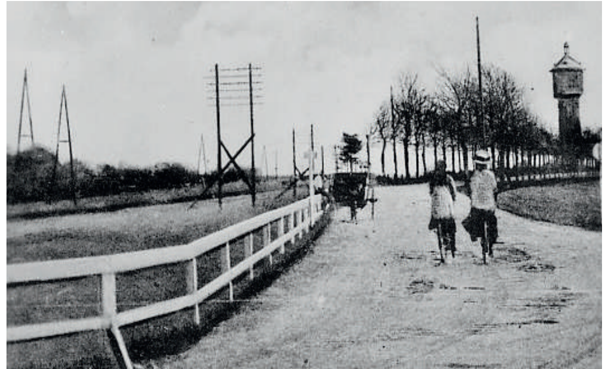
De Bussumergrintweg omstreeks 1912 langs de spoorlijn ter hoogte van waar later station Bussum Zuid zou komen.

geschreven wordt) is nog maar fragmentarisch te herkennen. Het eerste deel in Hilversum is nu de Schuttersweg. Vanaf het kruispunt met de 's-Gravelandseweg, Quatre Bras, heet de weg Bussumergrintweg. Een druk stukje ringweg, dat wandelend of met de fiets aan de hand, slechts met moeite in de bocht overgestoken kan worden. Daarna sta je plotseling op de Grintweg in de rustige villawijk Trompenberg. De weg loopt langs het Melkhuisje. Bekend geworden als tennispark, maar begonnen als rustplek voor reizigers tussen Hilversum en Bussum. Dan komt het kaarsrechte stuk langs het Spanderswoud en de Kamphoeve, omzoomd met beuken. Het langste stuk is gemeente Hilversum, het laatste stuk gemeente Gooise Meren. De weg komt uit op de Naarderweg. Het stuk tussen de driesprong Leidse bosje en de afslag ter hoogte van de watertoren