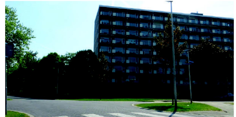
De Vogelhof in 2013