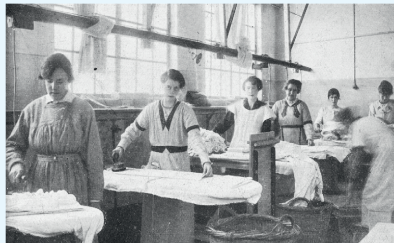
Strijkzaal van de Gooische.

gen herinnering', De Omroeper nr. 2, 1997; 'Bye bye Bussum', Enter Media 2016;