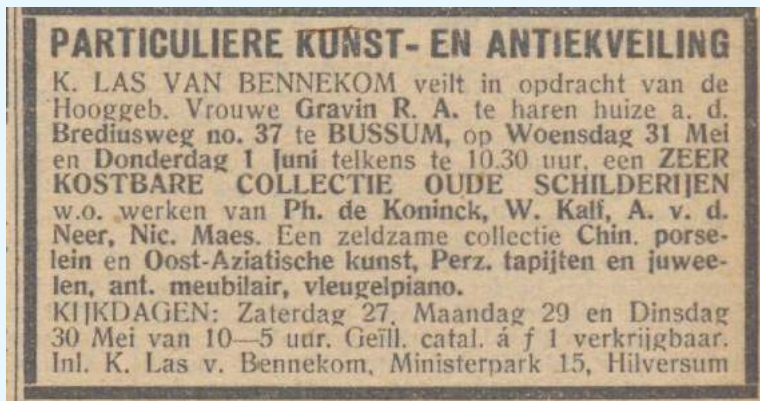
Gooi en Eemlander, 25 mei 1944.