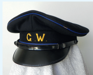
Pet Gemeente Werken Bussum circa 1948

Het onderhoud aan de schoolgebouwen gebeurde zo veel mogelijk tijdens de schoolvakanties. Een timmerman was dan in een verder verlaten gebouw bezig om meubilair te repareren, de klimrekken, matten, kussens en toestellen te controleren en met het vervangen van ringen en klimtouwen.