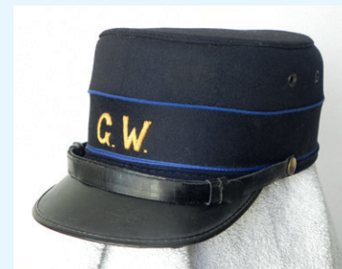
Pet Gemeente Werken Bussum jaren vijftig

De meeste mensen van de buitendienst van Gemeentewerken woonden in Bussum. Zij fietsen om twaalf uur naar huis om warm te eten. Daarna een kort dutje en weer aan het werk. De straatvegers hadden een dichte metalen bak met aan beide zijden een klep om het straatvuil in te scheppen. Op een veegfiets zat een takkenbezem, een schep en gereedschap, onder andere om straatputten open te maken.