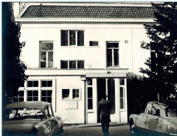
Bureau Gemeentewerken, Meerweg, hoek Nieuwe 's-Gravelandseweg