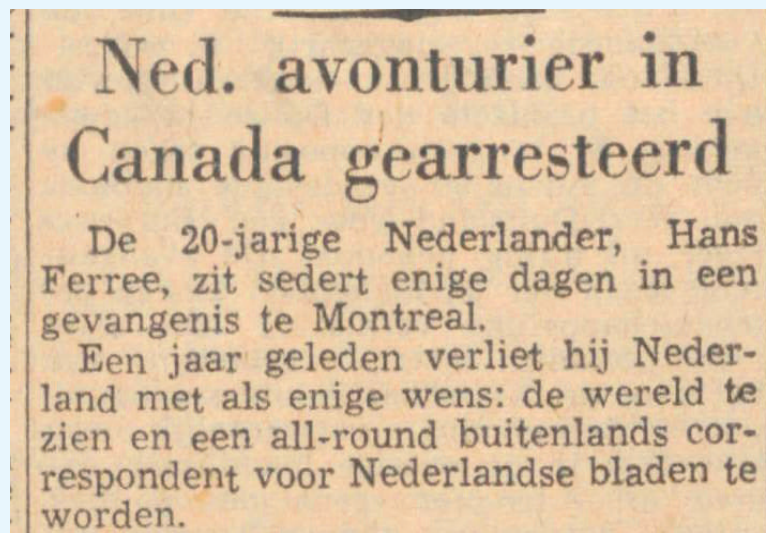
Trouw 23 oktober 1950