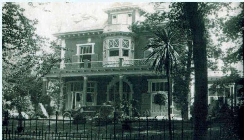
Huize Van Vleuten aan de 's-Gravelandscheweg omstreeks 1920.

Samuel verkocht na de dood van zijn vrouw de grote villa en ging in een kleiner huis aan de Wladimirlaan wonen. Dat 'klein' is maar betrekkelijk, want het werd de imposante villa op nummer 1 waar