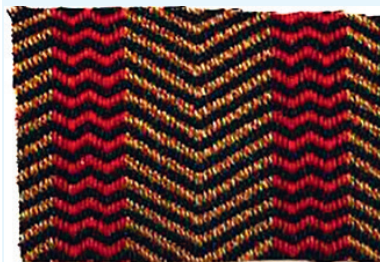
Koehaartapijt (coll. Openluchtmuseum Arnhem)

'In het Gooi, het land van de koehaarspinnerij en tapijtenweverijen, heeft de huisindustrie lang stand gehouden. Juist anders dan elders is hier het spinnen steeds huisarbeid gebleven die verricht werd door vrouwen, kinderen en