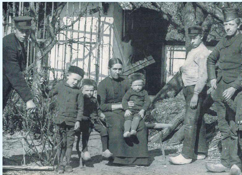
Erfgooiersgezin in 1892

op iets wat met de geschiedenis van de erfgooiers te maken heeft. Het erfgooiersgebied besloeg het hele Gooi. De tocht beperkt zich tot Naarden en Bussum en omgeving omdat het, samen met het introductiefilmpje, een goed beeld geeft van wat erfgooiers in het verre en recente verleden hebben gedaan en meegemaakt.