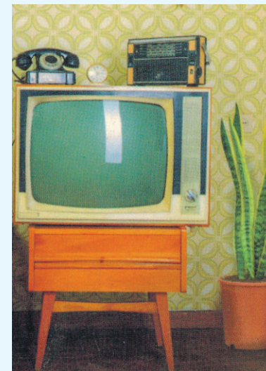
Een radio, een tv-toestel en een telefoon: 7 punten!