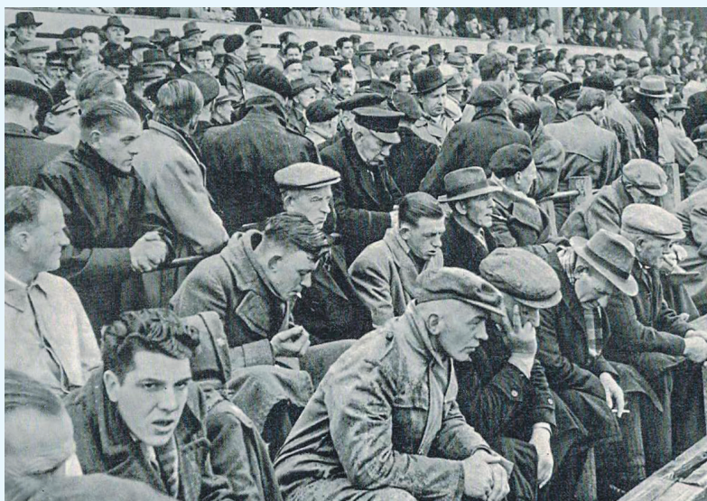
Erfgooiers bijeen in 1955 (foto Goois Museum)

Bron: A.C.J. de Vrankrijker: Stad en Lande van Gooiland. Van Dishoeck 1968.