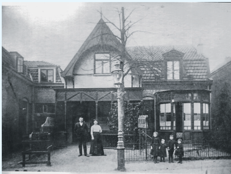
Koffiehuis Heerenstraat 16

op zaterdag- en zondagmiddag matinee's en kindervoorstellingen te geven. F.Kleij stelt het Bussumse gemeentebestuur gerust: "Ued de verzekering gevende steeds zorg te zullen dragen dat in de te vertoonen programmaas geen kwetzende films opgenomen zullen worden".