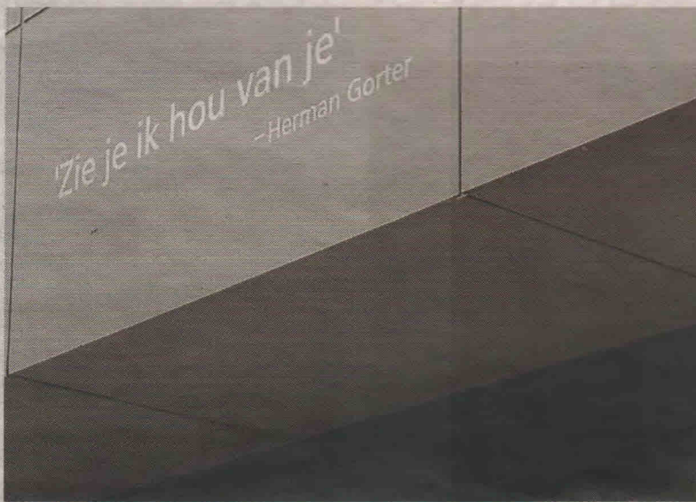
Dichtregel van Gorter op de C&A-gevel.