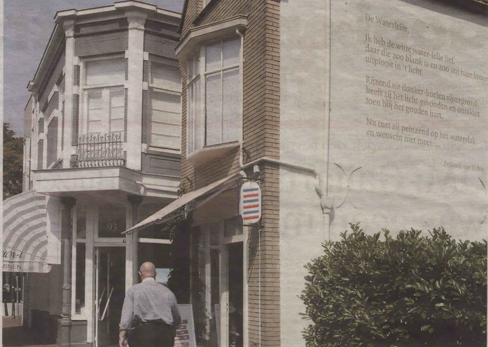
Op de zijgevel bij kapsalon Slimani staat het gedicht van Frederik van Eeden.

'Het mooiste zou zijn een spreuk van Koot en Bie'