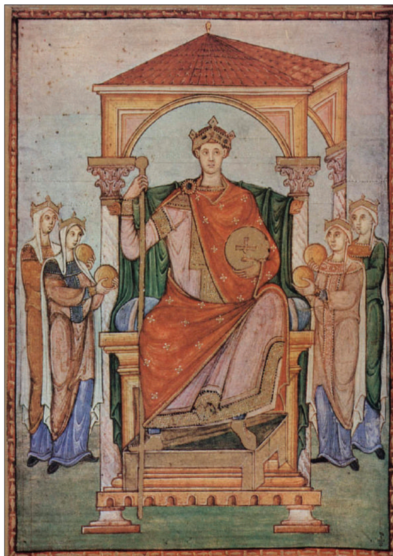
■ Keizer Otto, miniatuur in Registrum Gregorii (Musée Condé).

FOTO EN TEKST: STREEKARCHIEF GOOISE MEREN