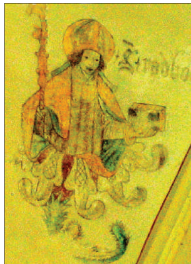
■ Bisschop Radboud, gewelfafbeelding in de Broerenkerk in Zwolle.

Lotharius (941-986) volgde zijn vader Lodewijk IV na diens dood in 954 op als koning van Frankrijk. In 965 trouwde hij met de stiefdochter van keizer Otto I, Emma. Het voorstel 'de beroemde schoonzoon van Keizer Otto' in een straatnaam te vernoemen werd door de gemeenteraad enthousiast aangenomen.