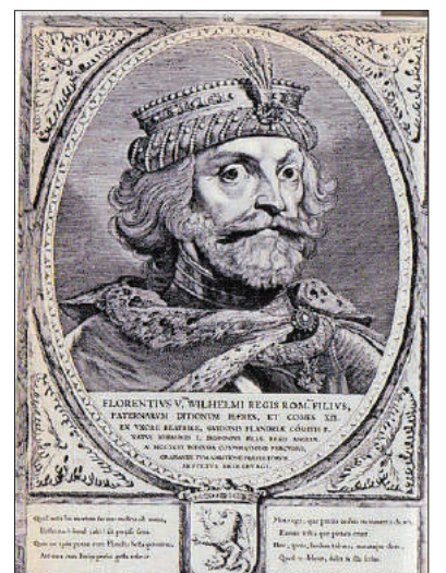
■ Graaf Floris V.