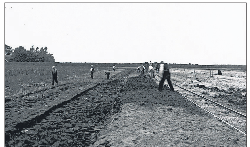
■ De aanleg van sportvelden in 1932.

Verder zou er een grote vijver komen met een diepte van 50 centimeter, een lengte van 181 meter en een breedte van 82 meter, die 's winters als ijsbaan kon dienen. Verder waren een kleine ronde