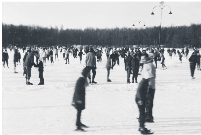
■ De ijsbaan in 1960.

vanaf 1918 het Laegieskamp van Hilversum, met het idee er sportvelden en/of een vuilstortplaats te realiseren. In 1926 kocht Bussum het gebied om er een vuilstortplaats van te maken. Hiertegen kwamen echter verscheidene raadsleden in het geweer: de geur zou hinderlijk zijn voor de omwonenden en de bezoekers van het zwembad, dat in 1924 op de Ondermeent aan de andere zijde van de Meerweg achter de voetbalvelden gerealiseerd was. Bovendien zouden de vuilniswagens door het Spiegel moeten, hetgeen op tegenstand van de bewoners zou stuiten.