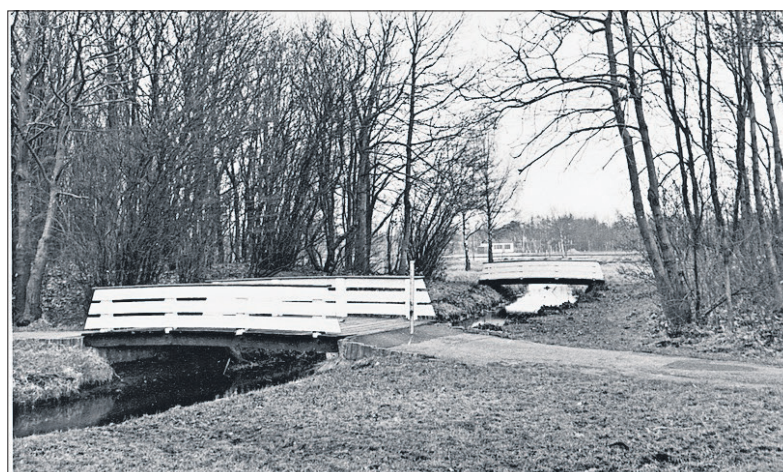
■ Het wandelpark in 1960.

de HBS' omdat ze het maar een onhygiënische toestand vonden. In later jaren kwam er ook een kantoortje voor de afgifte van schoenen. Daarnaast kwam er elektrische verlichting. In de oorlogsjaren werden aan de oostkant van het Laegieskamp tennisbanen aangelegd en nog later ook aan de noordkant. De ijsbaan heeft bestaan tot 1968. Tegenwoordig is het middelste deel van het Laegieskamp niet meer toegankelijk. Alleen vanaf de paden eromheen kan men dit bijzondere gebied nog zien.