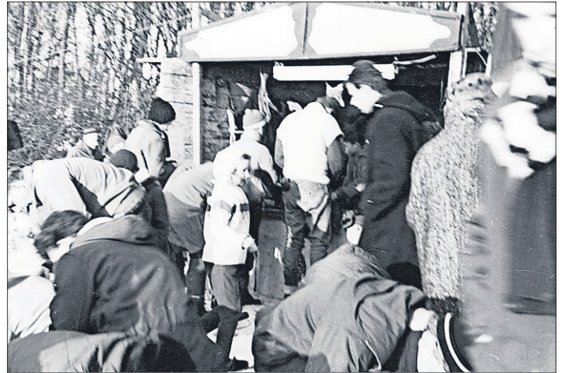
■ Het kantoortje voor afgifte van de schoenen.

In februari 1932 presenteerde de directeur van gemeentewerken een 'plan voor de inrichting van Laegieskamp als verpozingsoord'. Het plan voorzag in drie hockeybanen, een extra voetbalveld en een veld voor korfbal of atletiek.