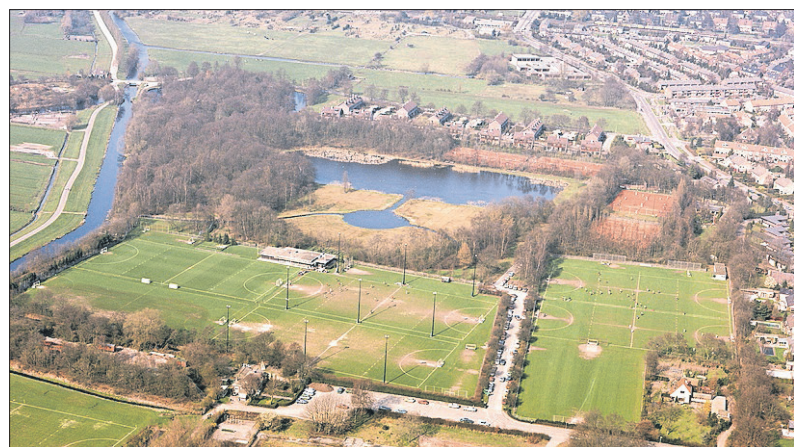
■ Het Laegieskamp in 1975.

Bij de ijsbaan werd een huisje geplaatst van waaruit als de ijsbaan geopend was koek-en-zopie kon worden verkocht. De Bussumsche krant meldde dat deze voorziening niet werd gewaardeerd door de 'nymfen van het Lyceum en