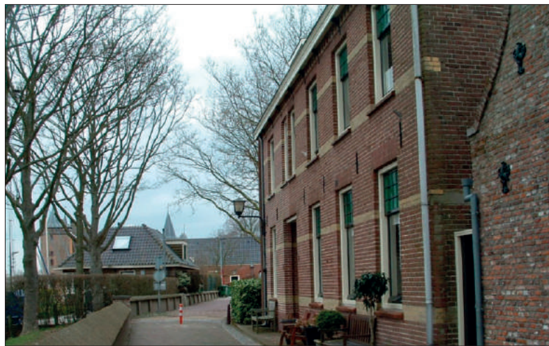
Herengracht 6, 7 en 8: het weeshuis waarin nooit wezen woonden.

In de loop van de achttiende eeuw werd het weeshuis een welvaren-