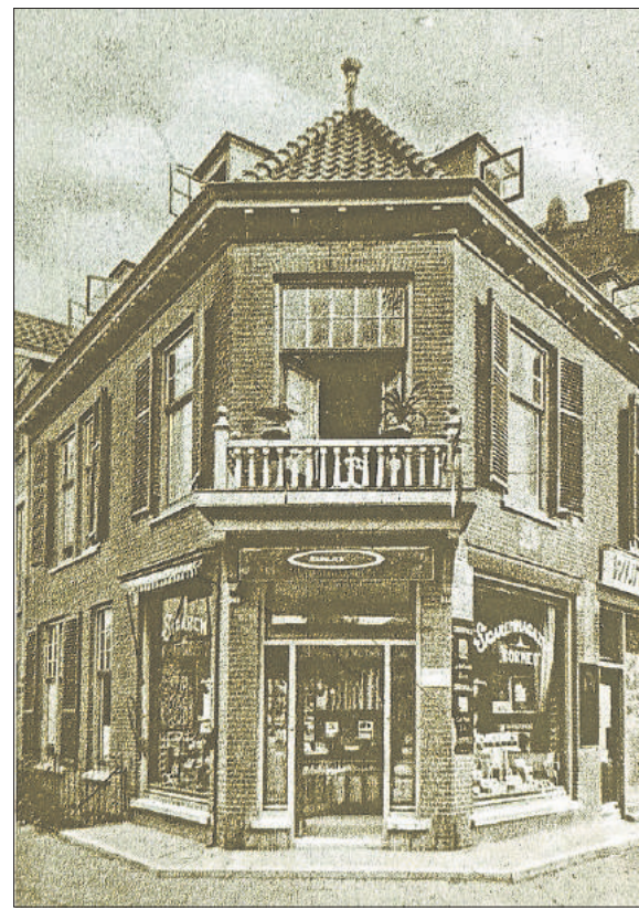
■ Sigarenmagazijn Borneo, Brinklaan 94.