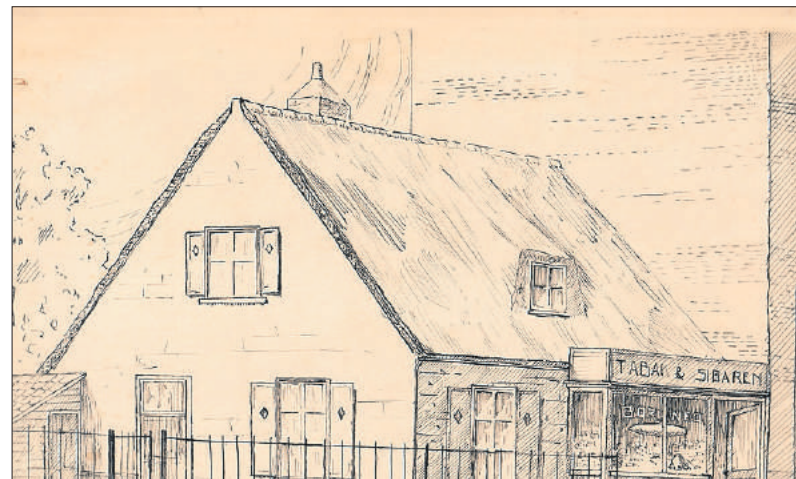
■ Vermoedelijk de eerste winkel op Brinklaan 88a.

winkel begon, stond dat pand er nog niet. Hij startte zijn sigarenmagazijn Borneo op vrijwel dezelfde plek. Er zijn twee tekeningen bewaard gebleven in het album dat zijn vrouw en dochter samenstelden ter gelegenheid van het 50-jarig bestaan van de zaak in november 1951. Wellicht stelt een van die twee tekeningen de winkel voor die hij in 1901 had. De tweede tekening is dan de winkel