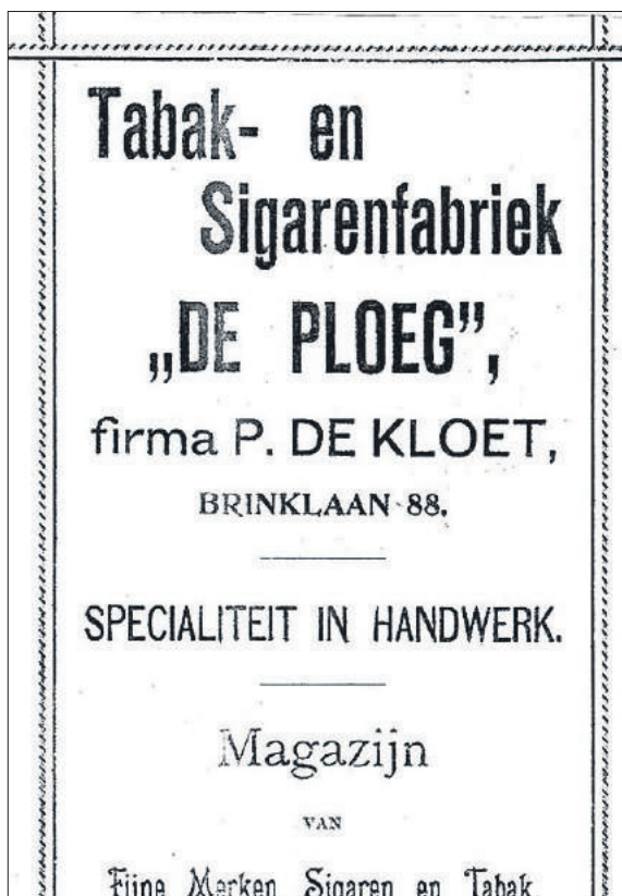
■ Advertentie uit 1900.