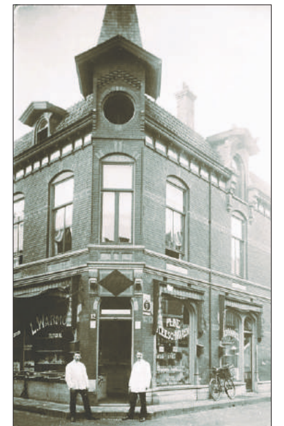
■ De winkel van Warmolts op de hoek Nassaulaan/Nassaustraat.