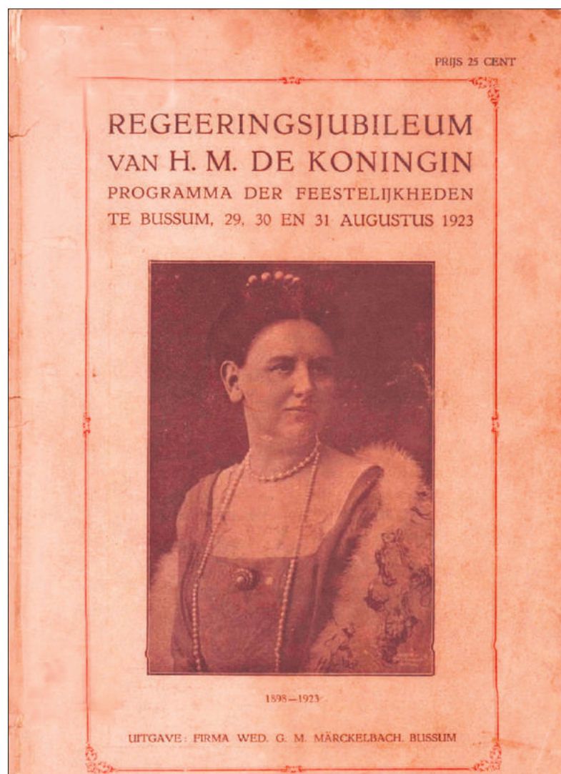
■ Het programmaboekje van het regeringsjubileum.