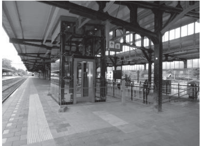
Opening van de liften in station Naarden-Bussum, 20 juni 2014

Sinds De Lift van Dick Maas in 1983 een kaskraker werd in de Nederlandse bioscopen, weten we dat liften zo hun eigen snode plannen kunnen hebben. In Bussum was zelfs een liftschacht al voldoende om ingenieurs, projectleiders en bouwvakkers tot wanhoop te drijven. Hieronder volgt een compilatie van berichten in de lokale persmedia (ontleend aan het digitaal archief van de Historische Kring Bussum http://www.historischekringbussum.nl/ ) die een waar horrorverhaal vertellen. Gelukkig weten we nu dat het sprookje goed afliep!