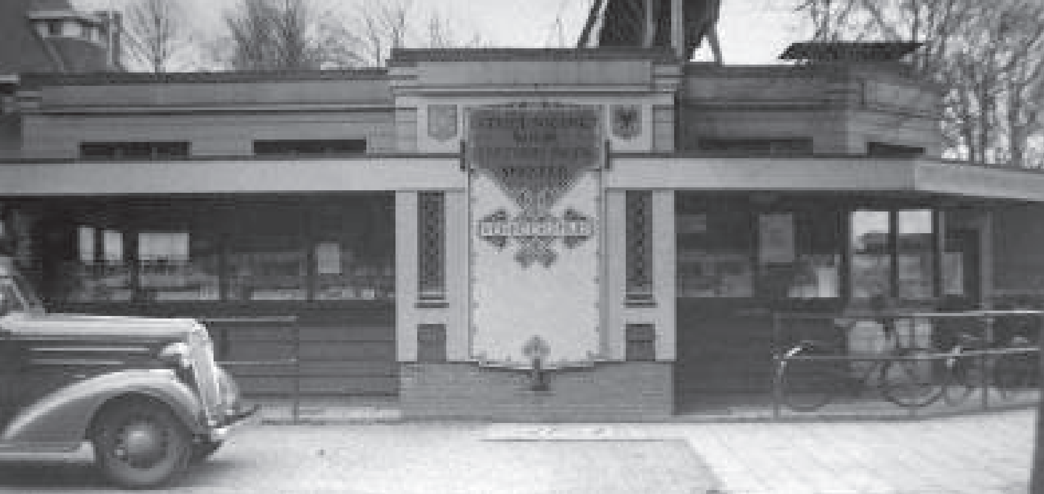
VVV kantoor, gebouwd in 1925, architect C.J.Kruisweg