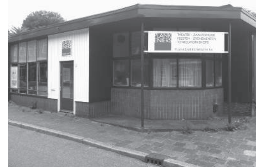
Het voormalige VVV-gebouwtje anno 2014

aangesloten op het spoorwegnet. Dat leidde ertoe dat het inwoneraantal steeg van circa 1000 in 1867 tot circa 20000 in 1922. De toenemende welvaart en de groei van de middenklasse resulteerde ook in wat we nu 'toerisme' noemen. De Dictionnaire Universelle du XIXe Siècle definieert de toerist als "iemand die uit nieuwsgierigheid en omdat hij niets om handen heeft, reist om het genoegen van het reizen" (2). Wat ook hielp was de uitvinding van de fiets door Lawson in 1880, gevolgd door de uitvinding van de luchtband door Dunlop in 1888. De Algemeene Nederlandsche Wielrijders Bond ANWB bestaat dan al vijf jaar. Het gevolg is dat op 5 juni 1911 (het was Pinksteren) maar liefst 18.000 'dagjesmensen' met 40 extra treinen naar Bussum komen. Een gelukkig toeval wil dat daar in 1910 net een eerste openbaar urinoir is geplaatst (3). De Gooi- en Eemlander van 7 juni 1911 vermeldt dat er "verder nog eenige duizende personen met andere vervoermiddelen" naar Bussum kwamen. Ook in de omliggende gemeentes "heerste een gezellige drukte".