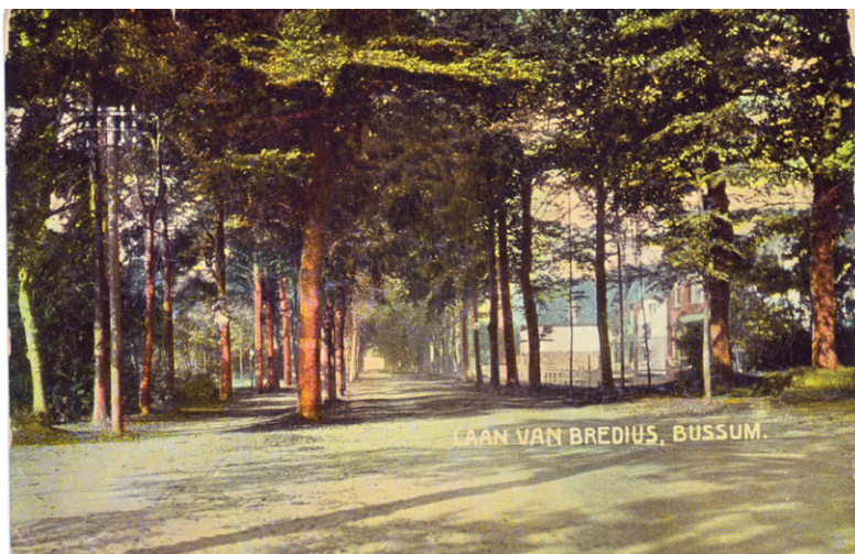
Het kruispunt richting Brediusweg in 1915.

Stationsweg 3 1404 AN Bussum www.historischekringbussum.nl tel. 035-69 129 68