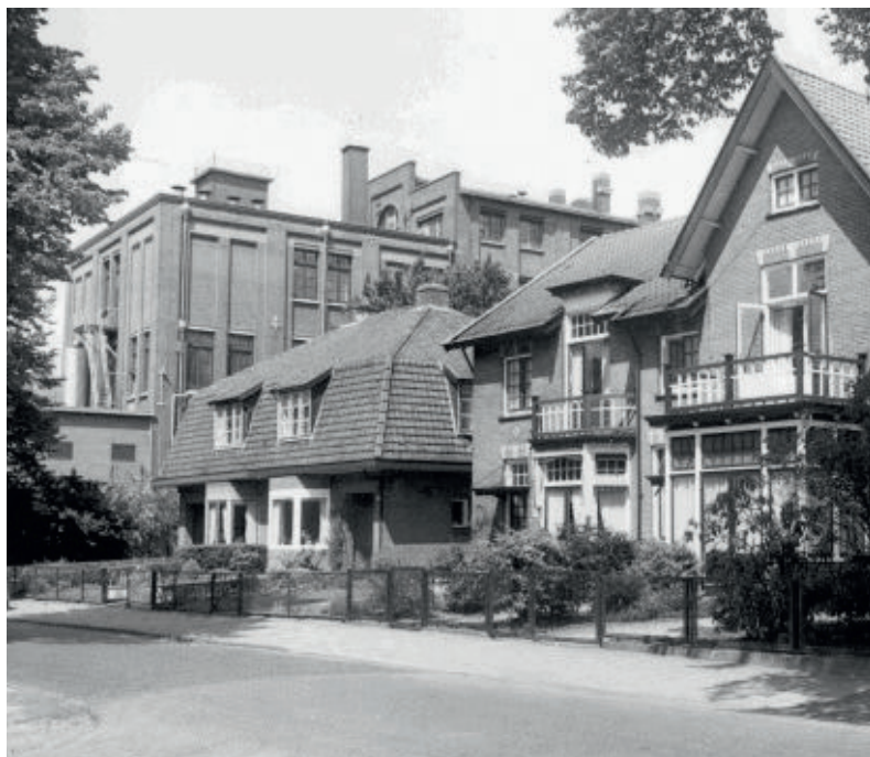
De fabriek in 1965 vóór de bouw van de bonenloods in 1966.

Gevierd wordt het 125-jarig bestaan van Bensdorp. Nadat wegens "de oorlogsomstandigheden" sober bij het honderdjarige bestaan in 1940 werd stilgestaan, is er nu alle gelegenheid om uitbundig feest te vieren. Het gaat de firma Bensdorp voor de wind. De vier vestigingen (naast Bussum ook in het Duitse Kleve, het Oostenrijkse Wenen en het Bra-