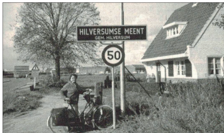
De toegangsweg naar de Meent vanuit het Spiegel in 1975 en in 2015.