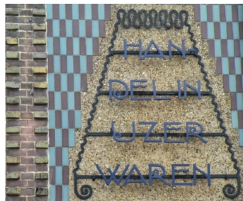
Het tegel- en smeedwerk tableau in de muur boven de etalage.