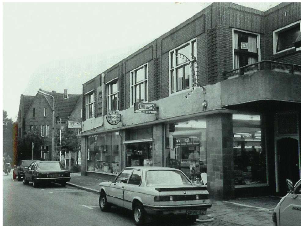
De zaak in Kapelstraat 44 in 1990.

zoon sticht ook een smederij. Hij sterft echter jong en de smederij gaat onder de naam van de nieuwe man van de weduwe door.