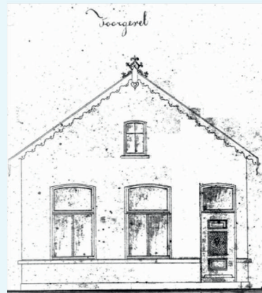
Bussumsche Reukwaterfabriek in 1876 (Arch. Gem. Gooische Meren)

verschenen advertenties waarin de eau de cologne c.q. het reukwater onder verschillende benamingen werden aanbevolen: Bussumsch Reukwater en Nederlandsche en Nederlandsche Eau de Cologne. Met het oog op de Indische markt werd in Rotterdam een depot geopend en werd in het Bataviaasch Handelsblad geadverteerd. Het mocht echter allemaal niet baten. Net als heel wat andere Bussumse nijverheid is de fabriek geen lang leven beschoren geweest. In 1885 werd de productie beëindigd, in 1888 werd het gebouw verkocht.