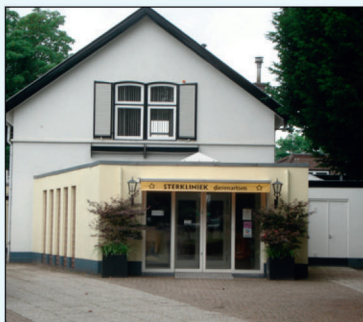
Brinklaan 148 in 2017