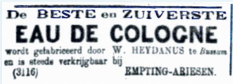
Advertentie Bataviaasch Handelsblad 18 aug. 1879