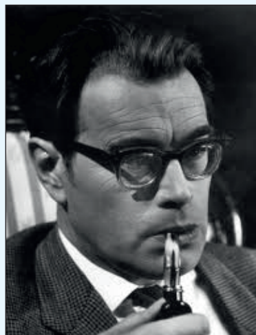
Godfried Bomans (1913-1971)

men waardeloos is. Dat een aantal volwassen mannen hun beste krachten wijden aan een product, dat na aankomst door de ontvanger direct wordt weggegooid, is een mystieke ervaring. Dit zijn heiligen of krankzinnigen. Maar