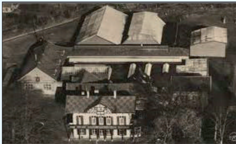
Van Meurs Golfkartonfabrieken NV (omstreeks 1960)