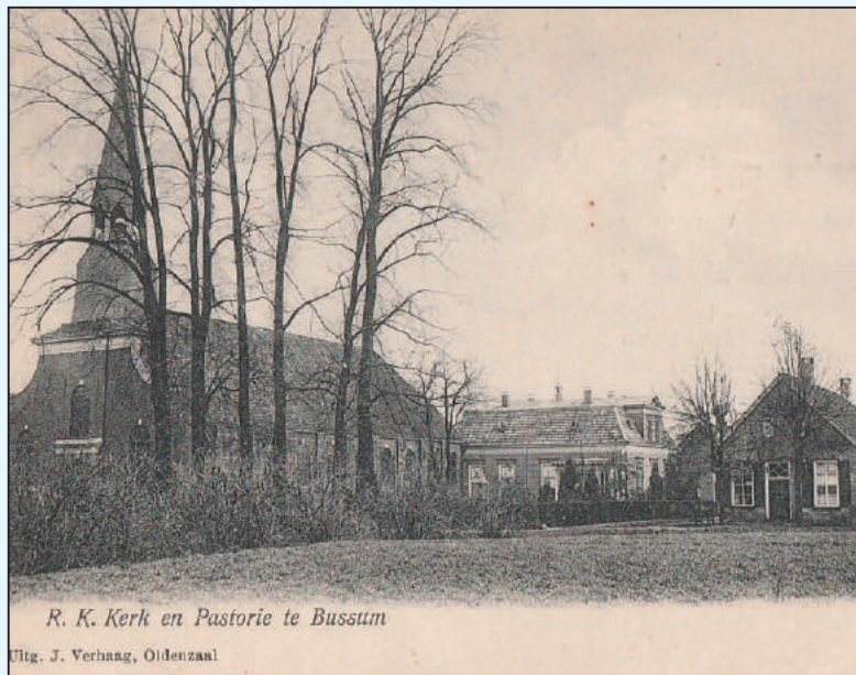
Prentbriefkaart met betwijfeld onderschrift.

R.K. Kerk en Pastorie te Bussum. Tussen het grote aanbod aan oude prentbriefkaarten op het internet duikt een kaart op met dit bijschrift. Naast de vele bekende kaarten ineens een wel heel bijzonder exemplaar. Tot nu toe ontbrak namelijk nog steeds een foto van de 19e-eeuwse Bussumse katholieke kerk.