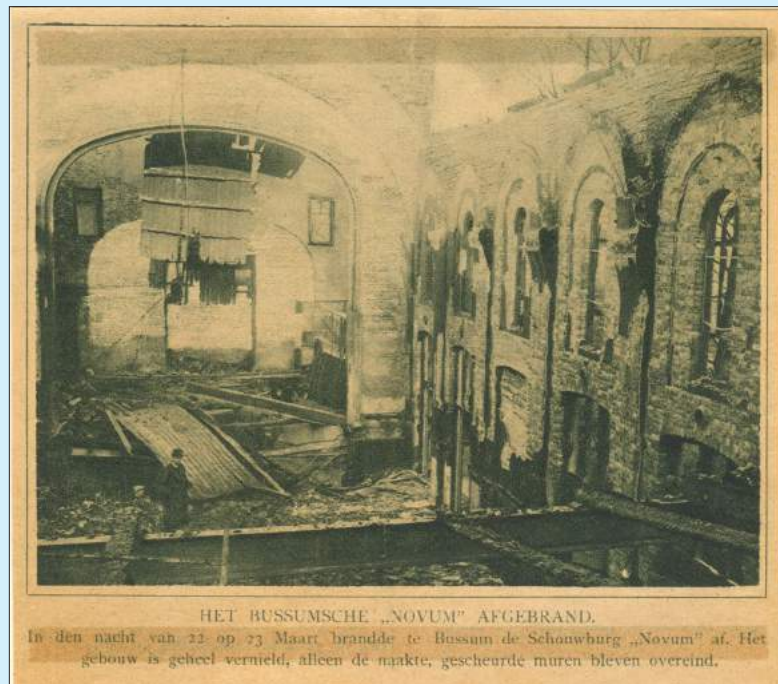
HET BUSSUMSCHE „NOVUM“ AFGEBRAND. In den nacht van 22 op 23 Maart brandde te Bussum de Schouwburg „Novum“ af. Het gebouw is geheel vernield, alleen de naakte, gescheurde muren bleven overeind.

Hoe populair het bioscoopbezoek een eeuw geleden is blijkt