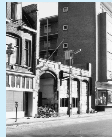
De sloop van Novum 24 februari 1974 (gemeentearchief Gooise Meren)

wel uit het aantal zitplaatsen. De zaal heeft maar liefst 425 stoelen. In drie rangen: parterre, balcon en loge. De bezoekers beneden in de zaal kunnen in de pauze voor consumpties terecht in het naastliggende café De Karseboom, boven is voor de anderen een koffiekamer. Bedenk dat Bussum dan nog twee