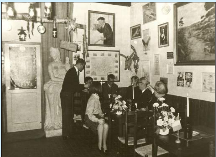
Restaurant Cheval Blanc in de Nassastraat.