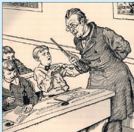
Impressie van een schoolklas in de 19e eeuw (tek. Pol Dom).