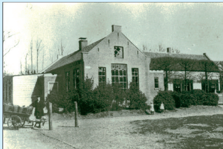
De Gemeenteschool; rechts de woning van de schoolmeester.

"Toen de schrijver [dokter Van Hengel.KO] in April de school