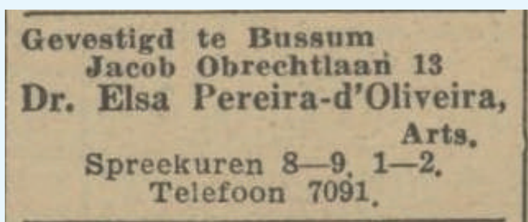
Algemeen Handelsblad 8 mei 1946.