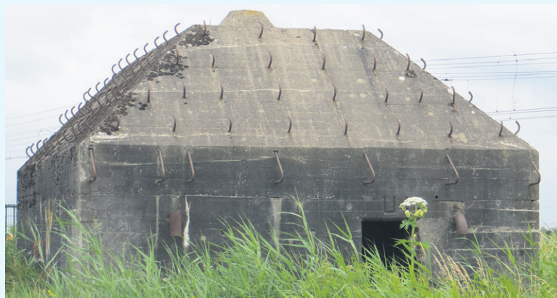
Groepsschuilplaats bij Naardermeer

Verspreid over het hele Waterliniegebied van Muiden tot aan de Biesbosch zijn 570 van deze groepsschuilplaatsen gebouwd; het merendeel (400) hiervan bestaat nog. Sommigen zijn inmiddels nagenoeg onzichtbaar in het landschap opgenomen. Een aantal is nooit afgebouwd. Een deel van het zand om beton te maken kwam uit de Bussumse zandzee, die daardoor in een plas veranderde.