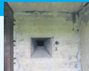
Geweerschietgat bij de ingang van een groepsschuilplaats

door een geweerschietgat (zie foto). De stalen deuren zijn echter zelden of nooit geplaatst en de ingangen zijn later vaak dichtgemaakt met baksteen en vervolgens gepleisterd. De schuilplaats moest met zijn 2.15 meter dikke dak bescherming bieden aan 10 tot 12 man. De haken op het dak dienden voor het aanbrengen van camouflagemiddelen, zoals netten of een gronddekking van gras-