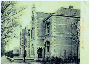
De Koningin Wilhelminaschool aan de Brinklaan