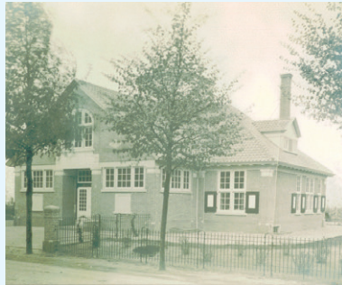
De Openbare Bibliotheek aan de Generaal de la Reijlaan

Bussum (en de rest van het Gooi) was omstreeks de vorige eeuwwisseling een walhalla voor architecten en aannemers. De spoorlijn had het Gooi bereikbaar gemaakt voor forenzammers en de vermogende Amsterdammers stonden in de rij om hier een perceel te kopen en er een villa op te laten bouwen.