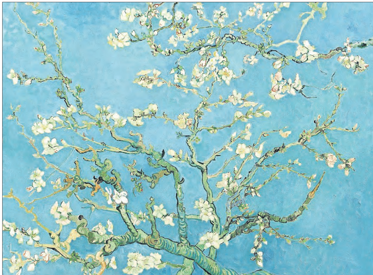
Amandelbloesem. Olieverf op doek, 73.3 cm x 92.4 cm. Van Gogh Museum, Amsterdam.

UIT DE FOTOCOLLECTIE VAN HET STREEKARCHIEF www.gooienvchthistorisch.nl 035 207 09 99 Cattenhagestraat 8, Naarden