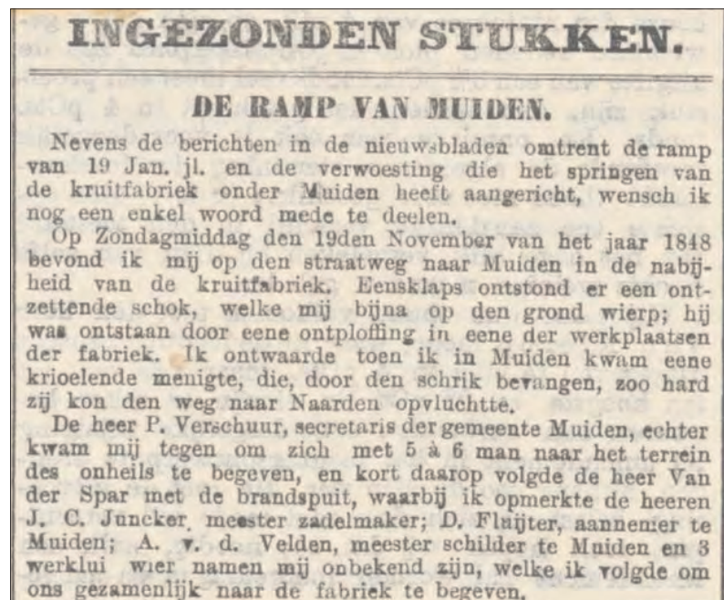
Algemeen Handelsblad van 19 februari 1883.