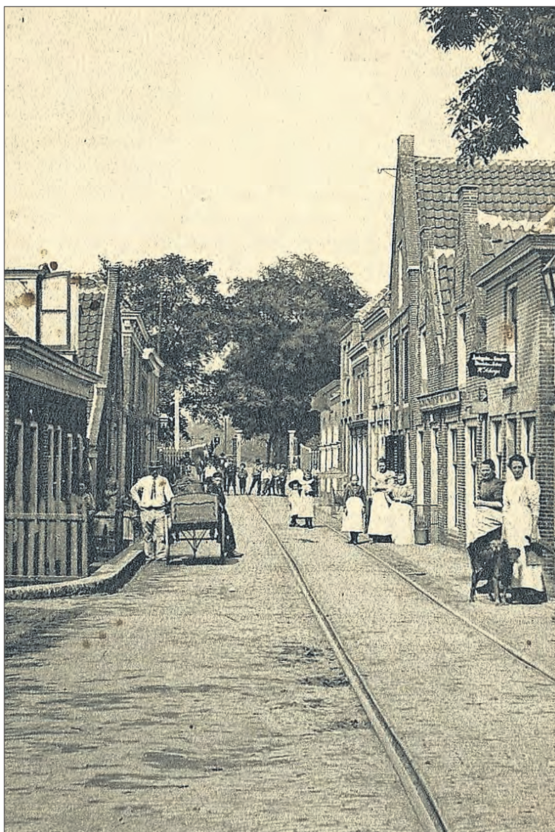
Amsterdamsche straat, Muiden (ca. 1900).