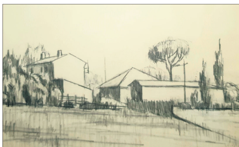
■ Tekening van Geert van Fastenhout (omstreeks 1958).