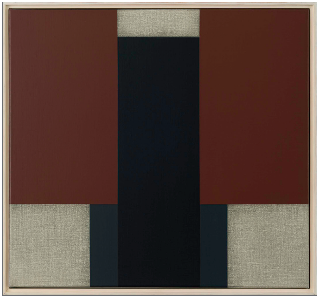
■ Schilderij 8 1993-1994 (60 bij 65 cm).