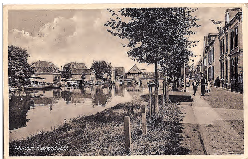
■ Heerengracht Zuid met in het midden het pompgebouw.