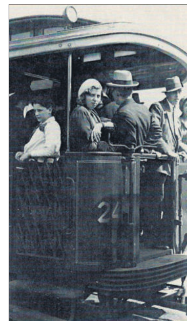
■ Op het open achterbalkon.