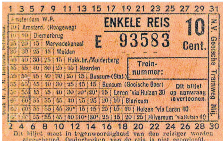
■ Een plaatsbewijs van de Gooische uit de jaren '30.

Traject De nieuwe tramweg had als beginpunt het stationsgebouw in Bussum. Het traject liep door een van de mooiste gedeeltes van het Gooi. Aanvankelijk waren er vier halteplaatsen: Station Naarden – Bussum, Abri (net ten zuiden van de vesting), Drafna (op de grens van Naarden en Huizen), Tram-