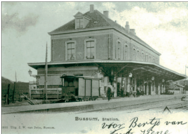
■ Station Naarden-Bussum met een goederenwagon van de tram.

Per 1 januari 1917 kon de Gooische Stoomtram de exploitatie van de zozeer door haar begeerde lijn van de HSM overnemen. Na