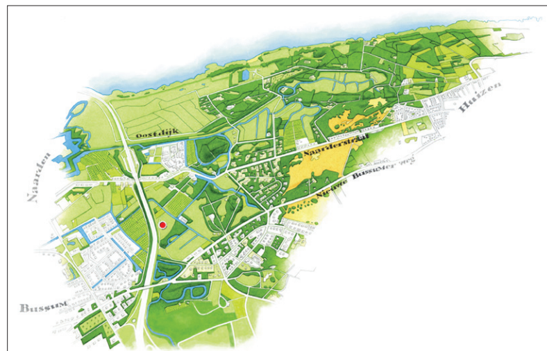
■ De plek van het laatste stuk van Kommerrust.

Na de dood van Uitenbogaert bleven zijn nazaten nog tot 1759 in bezit van Kommerrust. Daarna werden het buitenhuis en de boerderij al gauw afgebroken, omdat een groot deel van het terrein van Kommerrust moest worden afgezaagd om de schootsvelden van Naarden vrij te maken. Nabij de Bollelaan werd daarna een nieuwe boerderij gebouwd, die door het oorlogsgeweld bij de belegering van Naarden in 1814 werd verwoest. Hij werd door de nieuwe eigenaar J.P. van Rossum herbouwd, maar ging in 1941 helaas in vlammen op. Het laatste stuk van landgoed Kommerrust