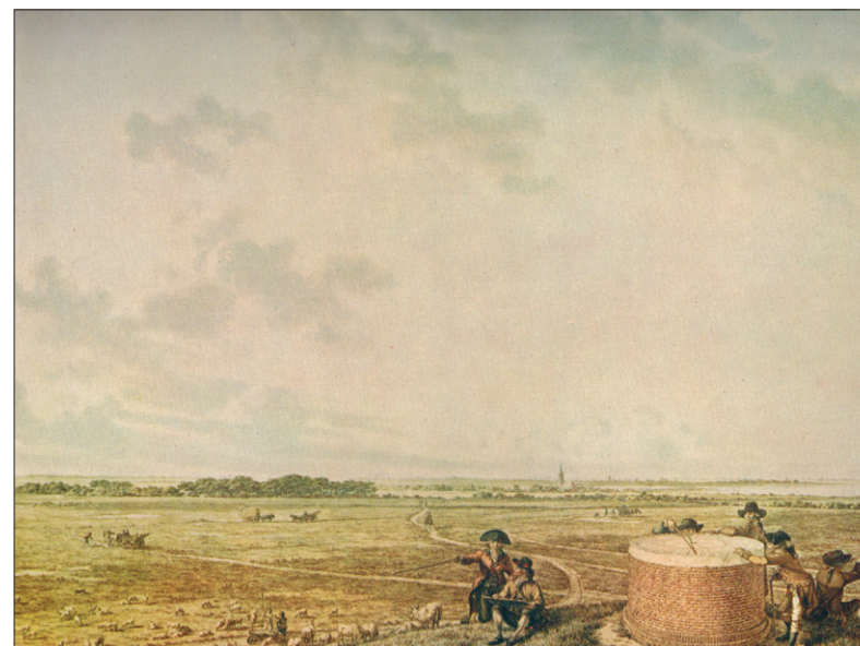
■ De ronde tafel van Bicker op een aquarel van Jacob Cats uit 1780.

landgoed Hilverbeek en de boerderij Stoffbergen had gekocht, deze tafel door een ronde tafel